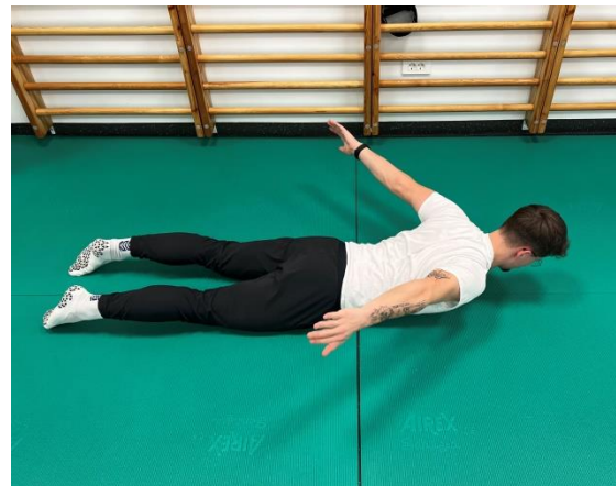
Izvedba vaje - ROKI ODROČIMO 45°