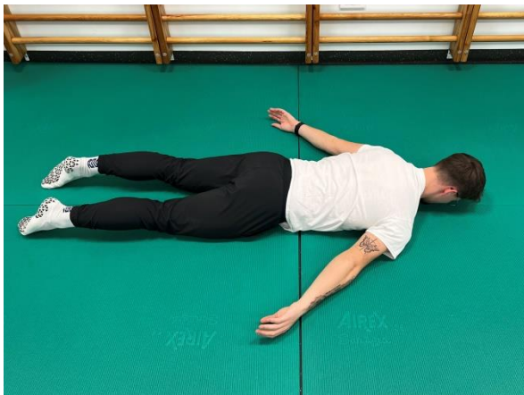
Začetni položaj - ROKI ODROČIMO 45°

Izvedba vaje: Glavo, ramenski obroč in roki dvignemo od podlage.