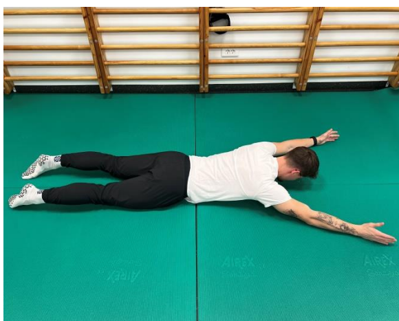
Začetni položaj - ROKI ODROČIMO NAD 90°