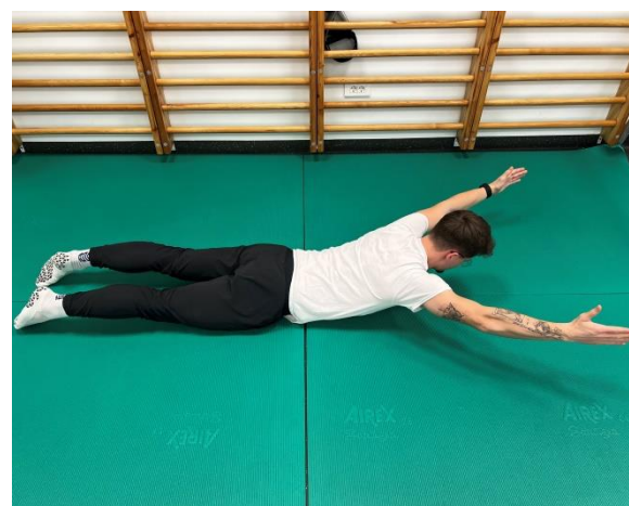
Izvedba vaje - ROKI ODROČIMO NAD 90°