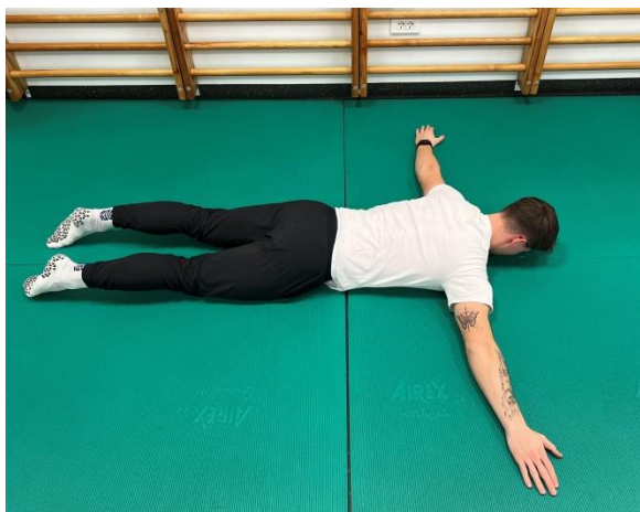
Začetni položaj - ROKI ODROČIMO 90°