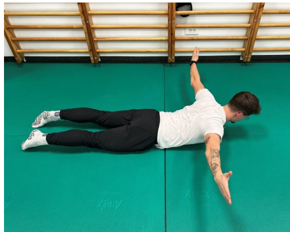
Izvedba vaje- ROKI ODROČIMO 90°