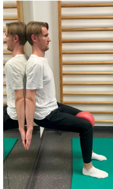
Izvedba vaje – z žogo