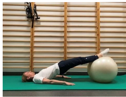
Izvedba vaje – izteg kolen