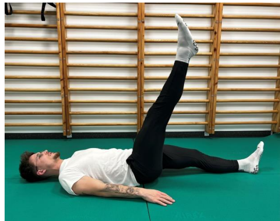
1-4 Potek izvedbe