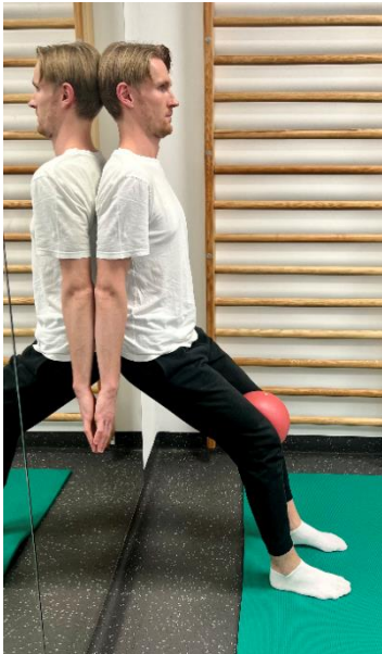
Začetni položaj – z žogo