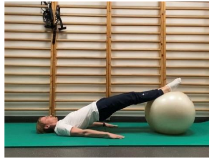
Izvedba vaje – dvig medenice