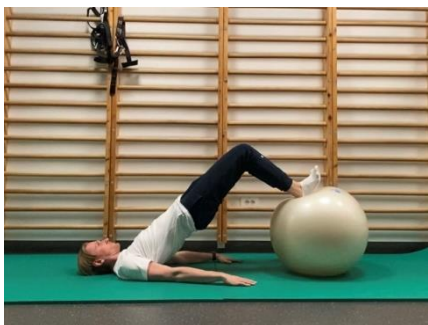
Izvedba vaje – pokrčena kolena